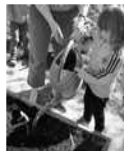
Il faut bien arroser !

Mois de mai: on sème les haricots, les radis et les épinards!