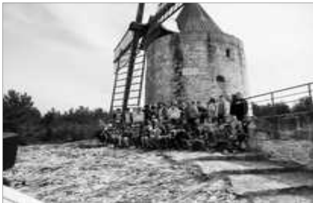
Le moulin d'Alphonse Daudet

Explications à la manade... avant de rencontrer les taureaux camarguais.