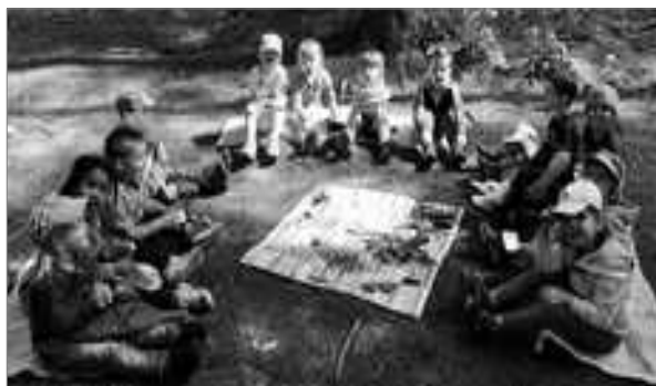
Nous avons cueilli de la nourriture : fougères, graines, pommes de pin, glands, brindilles, coquilles d'escargots... c'est ce que peuvent manger les renards, les chevreuils, les grives, les écureuils ...