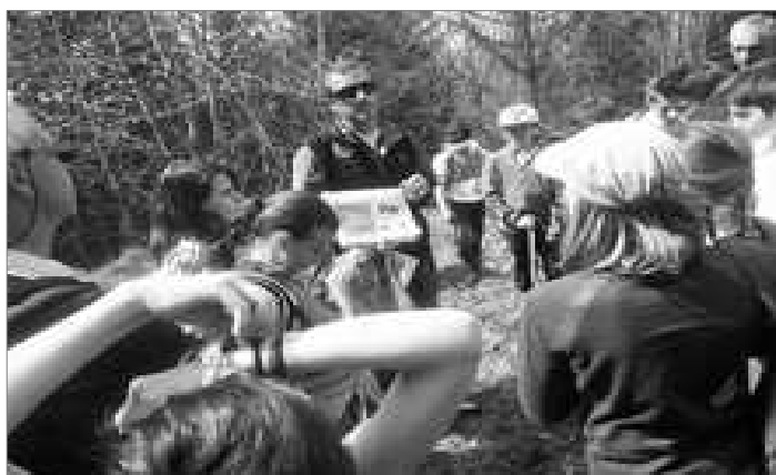
Les empreintes de chevreuils, cerfs, sangliers.