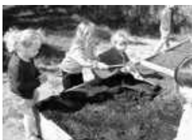
Préparation du terrain: on ratisse, on griffe

Au mois d'avril, Les TPS/PS/MS/GS ont planté des pommes de terre: