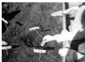
Plantation des pommes de terre: bien penser à mettre le germe vers le haut.