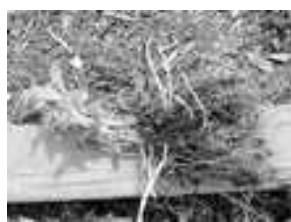
Les pommes de terre ont développé des racines dans la terre.

Quelques framboisiers ont résisté à l'hiver. Certains commencent à avoir des feuilles et des boutons de fleurs.