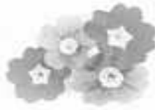
Observation et dessin d'une fleur de primevère.