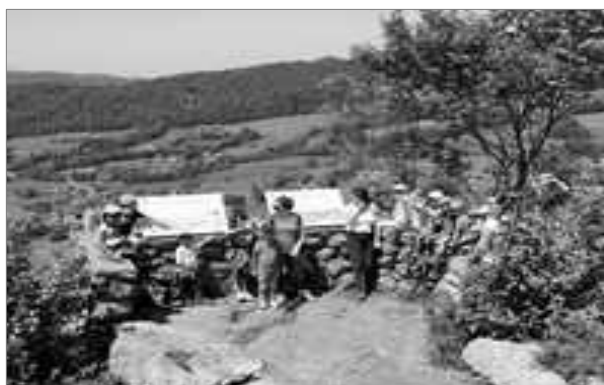
Tous réunis au belvédère à la fin de la promenade !