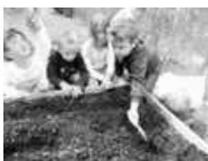
On gratte la terre avec une griffe

Mois de mai: on sème les haricots, les radis et les épinards!