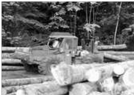
Le tracteur traînait des grumes afin de les rassembler

Et par chance, nous avons eu le plaisir de voir un tracteur forestier en plein travail ! Il rassemblait des grumes, c'était très impressionnant !