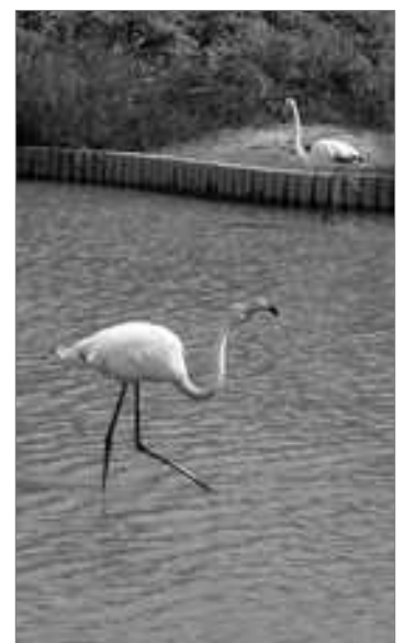
Les flamants roses du parc ornithologique

Sur la plage devant la mer... on invente une nouvelle façon de creuser le sable, tête la première !!