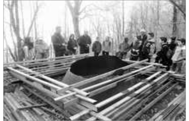
Sur les traces des charbonniers...