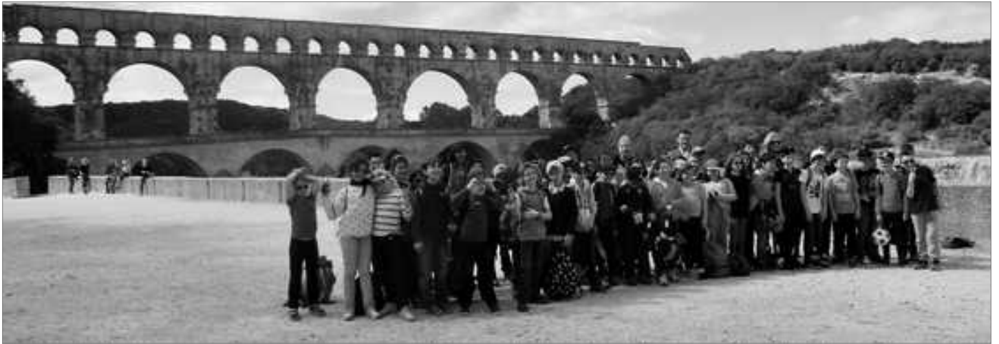
Devant le Pont du Gard

Cette année, les CM ont pu à nouveau découvrir la Camargue lors d'un séjour du 30 mars au 3 avril.