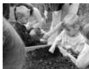
On met quelques graines de haricots dans un petit trou.

On observe les plantations déjà faites : framboisiers et pommes de terre