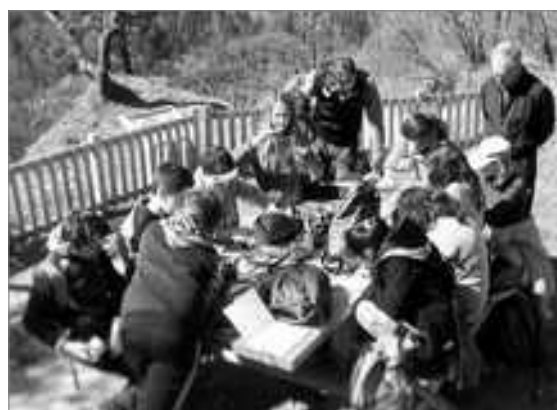
Prises de notes et dessins pendant la pause.