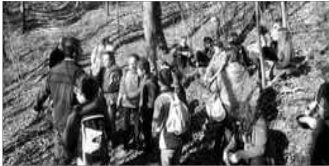
Explications en forêt : les essences d'arbres...